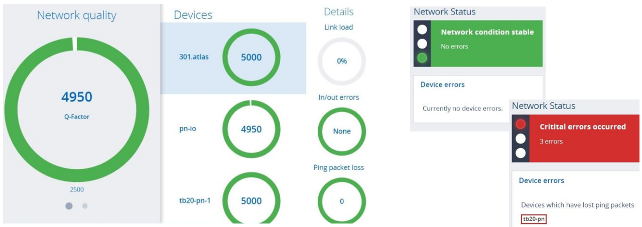
Q factor 및 신호등 표시

아틀라스는 네트워크 품질에 대하여 의미 있는 정보를 제공합니다. 네트워크의 정보를 얻는 것은 원리적으로 매우 복잡하지만, 아틀라스의 Q-factor (Quality factor) 표시 기능은 네트워크에 연결된 모든 장치에 알고리즘을 적용하여 단순하게 표시합니다. Q-factor 는 통신상태의 숫자표시기능으로 0~5000 사이 (자동차 산업 표준에 따라) 또는 0~100%사이의 숫자를 표시함으로써 네트워크 상태를 단순하게 가시화할 수 있습니다. 또한 신호등 표시 기능을 이용하여 네트워크 상태를 세가지 색상으로 간편하게 알 수 있습니다.